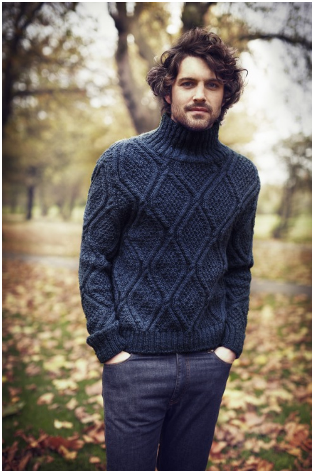
People Tree

masnija i kiselijska koža podložnija bakterijama koje uzrokuju prištiće i pretjerani sjaj, a dodamo li tome nečistoću uzrokovanu vanjskim utjecajima, tvrdom vodom ili duhanom, jasno je koliko su muškoj koži potrebne kvalitetna njega, čišćenje i zaštita.